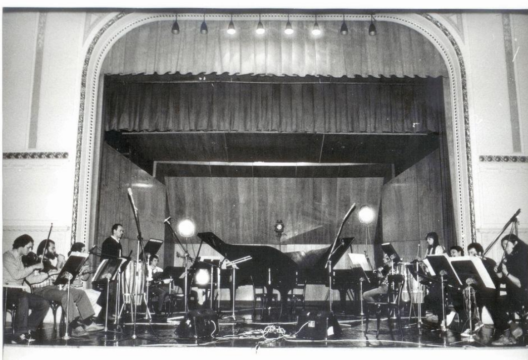
Körmeny Ferenc a kép baloldalán