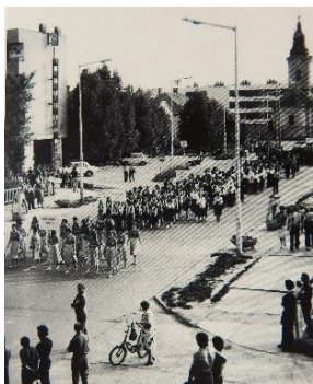
Kórusok felvonulása Békésen

Rozgonyi Éva: – A kodályi elvek örökre késztetést adtak mindannyiunknak, akik az ország legkülönbözőbb vidékeire kerültünk Tarhosról, hiszen a háború után Gulyás György is már az első években karvezetői tanfolyamot indított éneket tanítók részére! Vallotta, hogy a megoldás kulcsa az ő kezükben lehet, és van ma is. Ha meg tudunk nyerni sokakat, akik szívvel, lélekkel, megfelelő tudással, egy osztályban vagy kórusban szépen énekelnek, azok az élet más területén is közösségi emberré válnak. Társadalomformáló szerepük döntő lehet egy nemzet megítélésében! Ahogy Berzsenyi mondja: „Minden közös az egyesből ered.”