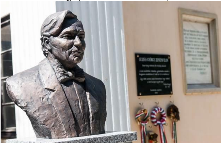
...Gulyás György mellszobra és emléktáblája 2016-ban, születésének 100. évfordulóján, a Zenepavilonnál (folytatás a 9/II. részben).