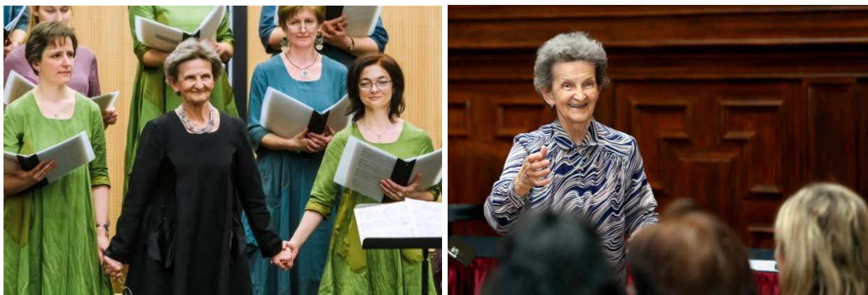
A Bartók Béla Női Kar örökös karnagyaként a szegedi Agórában és a KÓTA Nagydíjas karnagyaként