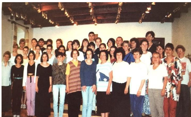
* A 2021-es Kőrösi Nyári Akadémia énektanár hallgatói