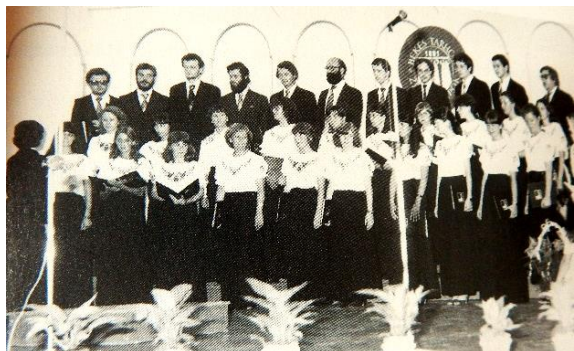
* A szegedi Bartók Vegyeskar Tarhoson