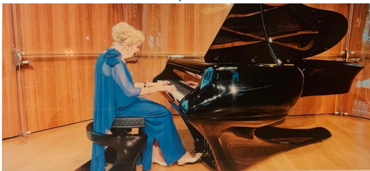
Koncert a Magyar Zene Házában a „Bogányi-zongorán (2022)