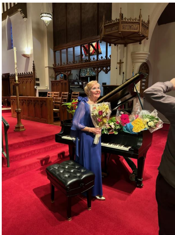
„Egy közelmúltbeli koncertem után San Marinóban”