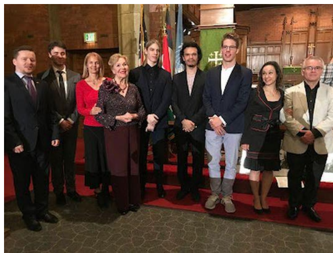
A Los Angeles-i Liszt Zongora- és Énekverseny fellépőivel, 2018-ban.

Aztán Budapesten, 1956. októberében, novemberében, a Pfeiffer család otthonát szétlőtték a szovjet tankok. A család Bécsbe menekült, 1957. február 12-én érkeztek Kaliforniába.