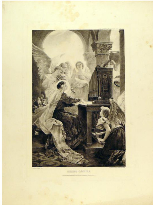
Knopp Imre (1867, Pest - 1945, Budapest) festménye alapján: Szent Cecília, a zene védőszentje. (az Országos Magyar Képzőművészeti Társulat műlapja, 1897)

egyhangúlag elismeri a szükségességét, és megszavazza az erre szükséges anyagi fedezetet. Egyben szükségesnek véli, hogy a karnagyképző a Hittudományi Akadémia égisze alatt folytassa működését. 6