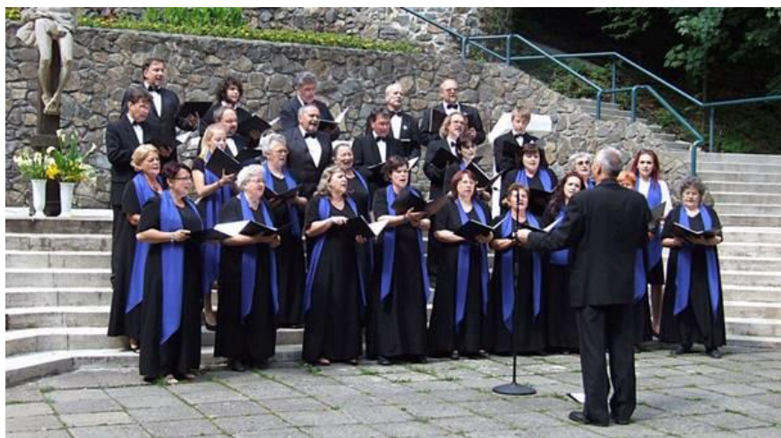
A Balassagyarmati Dalegylet fellépése Muzsikál az erdő nevű rendezvényen Mátraverebély-Szentkúton 2016-ban.