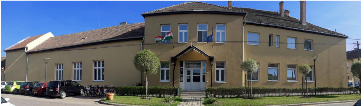
Rózsavölgyi Márk Alapfokú Művészeti Iskola, Balassagyarmat

Sokan, sokfélét leírtak már a zenéről. Hasonlították a szerelemhez – van, akinek erőt ad, mást legyöngít; az egyik embert a való élet fölé emeli, a másoknak a valóság megismerésében segít.