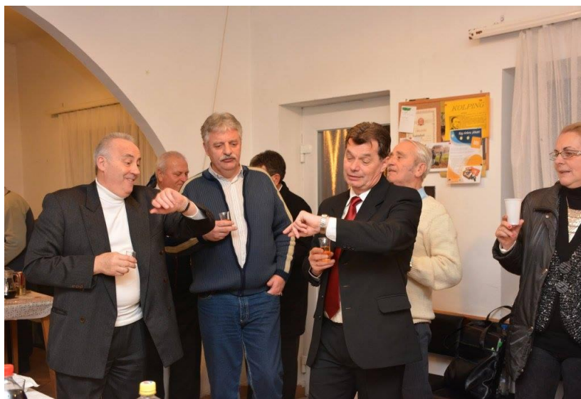
Az Érsekivadkerti Pedagógus Kórus vendégeként (2016)