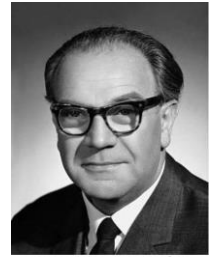
FORRAI MIKLÓS (1913-1998)

Forrai Miklós (1913–1998) 1934-ben alapította meg a Forrai Kórust, amelynek úttörő szerepe volt az a cappella előadói gyakorlat és a reneszánsz kórusirodalom és népszerűsítésében. Repertoárjukat tükrözik az általa szerkesztett Fallalla és az 1000 év kórusa c. kórusgyűjtemények, később az Öt évszázad kórusa . 1948-tól Bárdos Lajost követte a Budapesti Kórus élén, jelentős produkciókkal gazdagítva a magyar oratórium-éneklés hagyományát. 1973-ban kezdeményezésére alakult újjá a Liszt Ferenc Társaság. A Zeneakadémia tanáraként a szakemberképzésben, zenei ismeretterjesztő műsorok vezetőjeként a Magyar Televízióban sikerrel szolgálta a zenei nevelés ügyét.