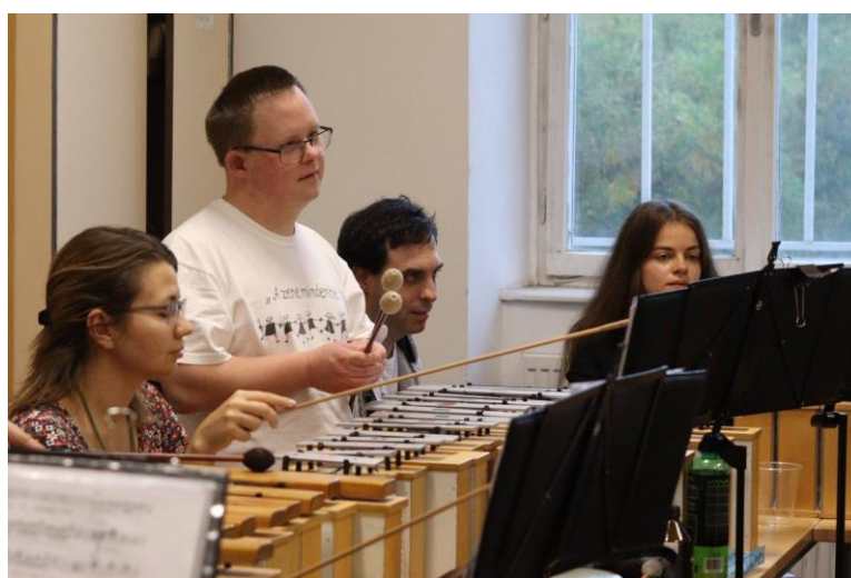
A Parafónia Zenekar muzsikusi és tanárai a próbán