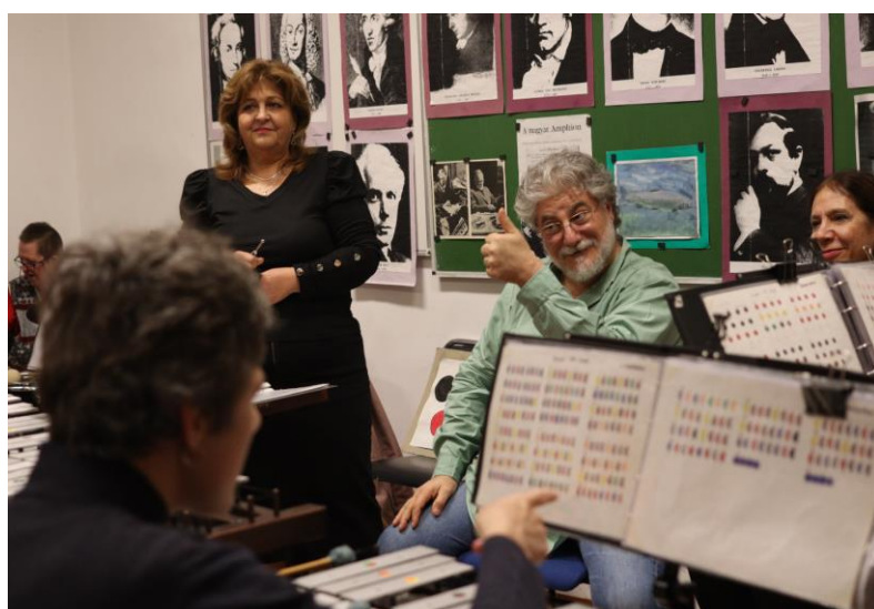
Fabényi Réka és José Cura próba közben