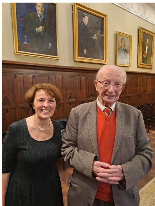
Földes Imre a 90. születésnapja tiszteletére rendezett ünnepségen Solymosi-Tari Emőkével a Zeneakadémia rektori tanácstermében (2024. március 12.)

Neked, de teljeskörűen ezt biztosan nem lehet leírni. Idén márciusban, a 92. születésnapodon a kórházban ünnepeltünk Téged. Két napra rá megint bementem Hozzád. Amikor elköszöntünk egymástól, és elindultam, az ajtóból még visszanéztem. Te is figyeltél engem, integettél, mosolyogtál. Őrzöm magamban ezt a szeretetteljes pillantást. Látod, egyvalamit mégsem tanítottál meg: azt, hogy hogyan legyünk mi itt Nélküled. Sokan fogunk odaképzelné a Zeneakadémia tanári páholyának első sorába, ahogyan álladat letámasztva, teljes odaadással figyeled a zenét. Most már az égi muzsikát hallgatod, és finom humoroddal azokkal a nagy szellemekkel társalogsz, akiket Általad ismerhettünk és szerethettünk meg.