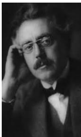
(Frank Bridge portréja: https://ehms.lib.umn.edu/frank-bridge/ )