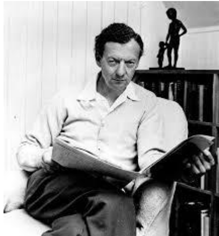
(Benjamin Britten portréja: Wikipédia)

Az első Britten volt: a Peter Grimes c. operájából kiemelt, önálló hangversenyszvitként is élő Négy tengeri közjáték. E négy csodálatos tétel az opera teljes világán végigvezet bennünket: a Hajnal lágy, simogató dallamai után más irányba vezet a Vasárnap reggel , a Holdfény ezúttal a legkevésbé sem lírai: a drámai feszültség egyre fokozódik, majd egy fugatóval válik könyörtelenné, végül a Vihar már az elkerülhetetlen tragédiát mutatja be. Rengeteg szépség van Britten zenéjében, melyek kiválóan szólaltak meg.