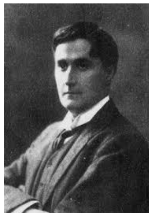
(Ralph Vaughan William portréja:)