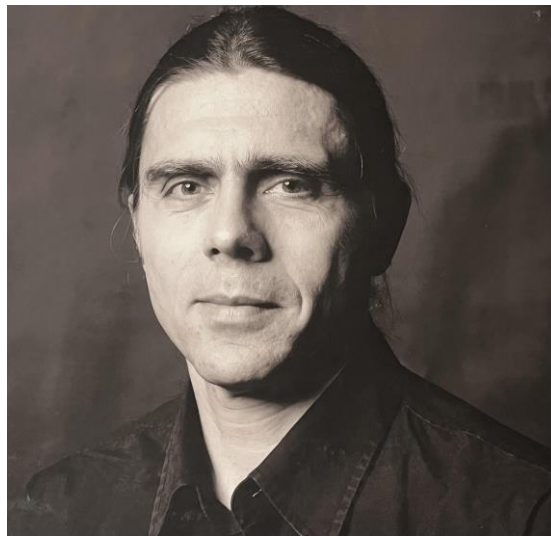
Az interjú végén egy “komoly” portré 6

kudarcként megélni a problémákat, hanem tapasztalatként. Ezt teszem magam is, immár több mint fél évszázada, s inspirál, hogy mindig akad új kihívás, új darab, új együttes.