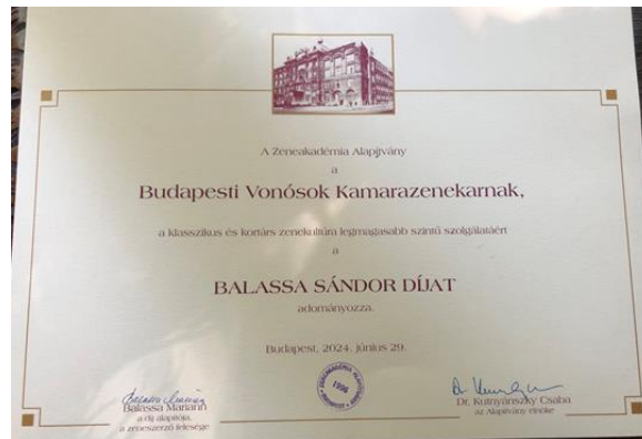
Oklevél a Budapesti Vonósok Kamarazenekarnak