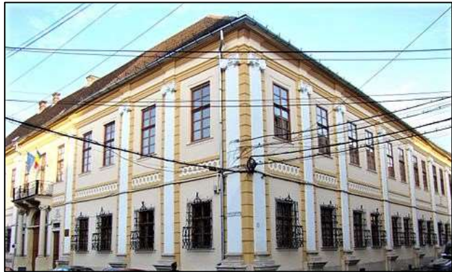
Toldalagi-Korda palota napjainkban