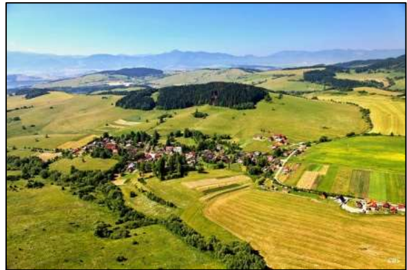
Izsépfalva, háttérben az Alacsony-Tátra