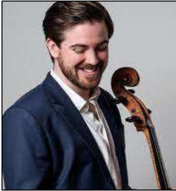
... és harminckét évesen

Szüleihez hasonlóan ő is igen aktív kamarazenesész, gyakran szerepel különféle összeállításokban, fesztiválok rendszeres fellépője.