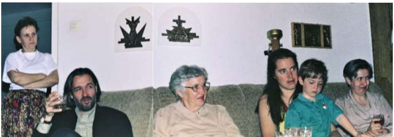
... és figyelmes hallgatósága: Édesanyja és a Lavotha-család