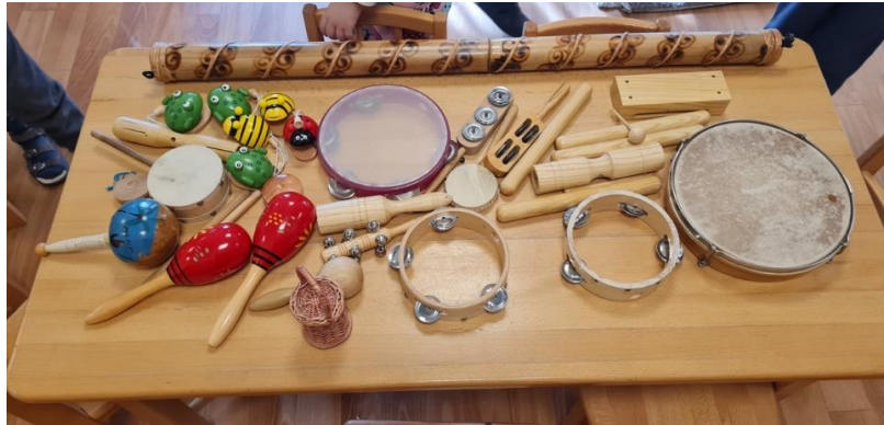
2.ábra: Vihart imitáló eszközök

A hangszerek (például: állatos kasztanyetták, csörgődob, rumbatök) kiosztását követően a gyerekek egyesével megszólaltathatták azokat, miközben megbeszéltük, hogy az adott hangszer a vihart melyik hangja lehet.