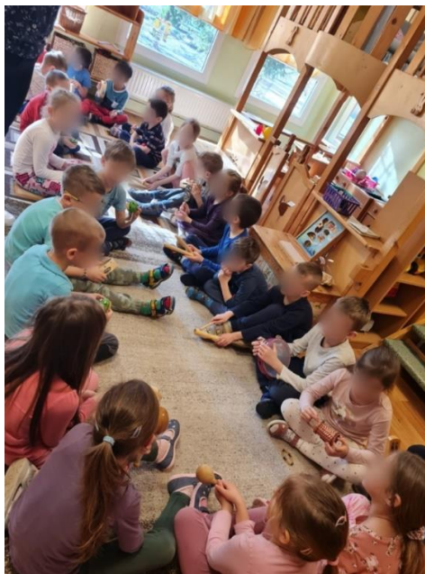
3.ábra: Közös vihar imitálás hangszerekkel

Először eső csepergésként az állatos kasztanyettákat és hang botokat, fa dobozokat szólaltatták meg, majd a csörgőket, csengő pálcákat, csörgő dobokat, rumbatököt, golyós dobot, agogot, eső hangszert (Terre bamboo) esőzésként égdörgéssel, végül a vihart egy égdörgéssel zártuk, melynek hangját egy nagy dob imitálta. Mindezt ezután visszafelé, a vihar elcsendesedésének sorrendjében is kipróbáltuk, majd utána mindkét sorrendet megismételtük gyakorlásként. Ezt követően az előzetesen megismert relációjelnek megfelelő halk-hangos hangok kézzel, térben mutatását újból megbeszéltük. A gyerekeknek az volt a feladata, hogy figyelniük kellett a kezemet: ahogyan nyitottam vagy zártam, az alapján kellett hangosan vagy pedig halkán megszólaltatni egyszerre az összes hangszert.