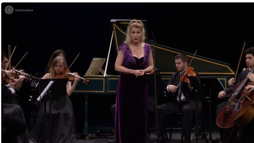
Händel - Ombra Mai fu (3:43)