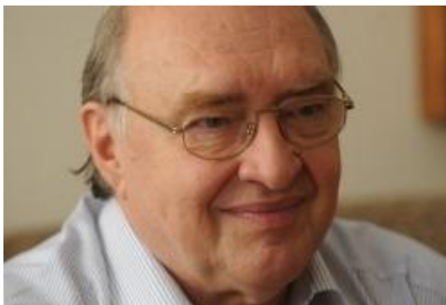
Weninger Richárd (Versec, 1934. december 21. – Szeged, 2011. november 2.) hárfa-művész-tanár, karmester és zenepedagógus