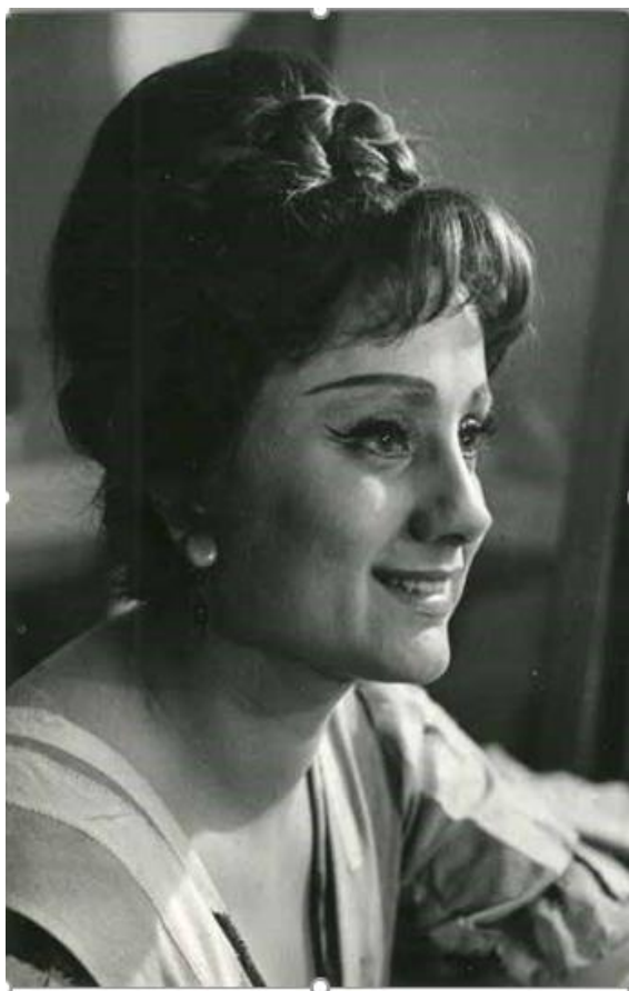
1964. november 15. – Mozart: A varázsfuvola – Első gyermek