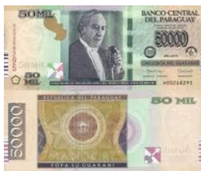
Más kontinensek bankjegyein is találkozunk hasonló gyakorlattal, pl. Paraguay 50.000 guarani értékű papírpénzén Agostin Pío Barrios (Mangoré) gitáros zeneszerző képe szerepel.

A filatélia hasonlóan a történelem segéttudománya. Minden ország bélyegein sok példát találunk jubileumokhoz kötött zenei témákra, zeneszerzők arcképe, zenei épületek képe, események színhelye, zeneművek tartalma stb. jelenhet meg rajtuk.