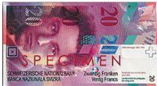
Svájc, Arthur Honegger, 20 frank, 1995, tábla előtti képe, zeneeszközök részei, kotta