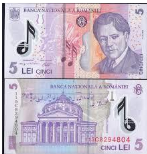
Románia, G. Enescu, 5 lei (előtte: 50.000 lei), 2005, bukaresti Román Athenaeum koncertterem