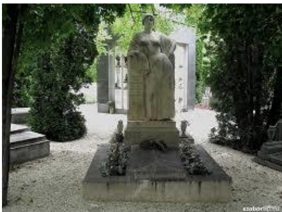
Pátzay Pál: Kodály Zoltán