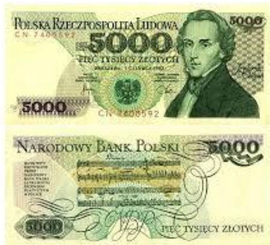
Lengyelország, F. Chopin, 5000 zloty, 1982, egy polonéz kottája