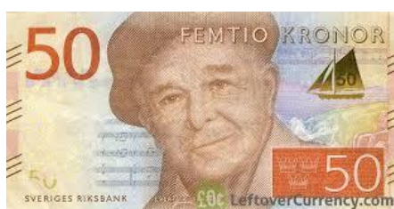
Svédország, E. Taube (gitáros zeneszerző), 50 korona, 2015, vitorlás vízennő, rajzolt hajó vízennő