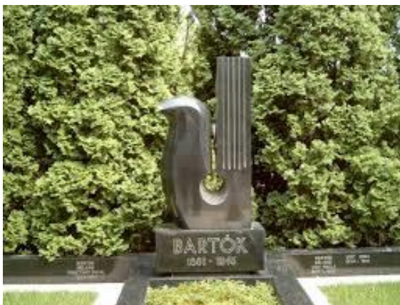
Borsos Miklós: Bartók Béla

A történelem az az ismerethalmaz, amely az érdeklődő ember számára a legfontosabb összefüggésekre példáival kinyitja a kaput. Számomra kb. 25 éves korom óta jelent sokat a történelmi tudás, értve ez alatt az emberi szellem mindegyik szegmentumának történetiségét. A zene-ének szerepére a történelemben több tanulmány hívja fel a figyelmet. A Marseillaise a francia forradalomban, Wagner germán mitológiát feldolgozó operái a német nemzeti tudat kialakulásában, Verdi operái az olasz szabadságharcban és egyesülésben, Erkel himnusza és operái a magyar független nemzeti tudat alakításában szép példái ennek a hatásnak.