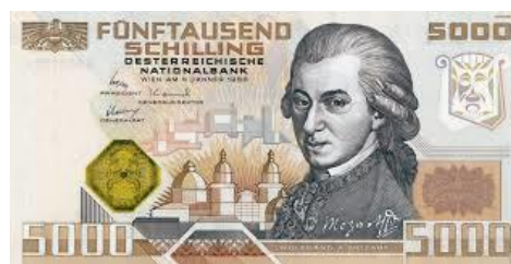
W. A. Mozart, 5000 schilling, 1988, Salzburg, épületek, álarc, a Bécsi Állami Operaház