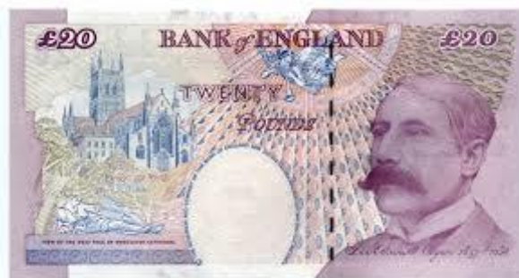
Nagy-Britannia. E. Elgar, 20 pounds, 2010, Worcester-katedrális