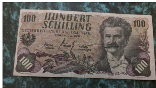
Ausztria, ifj. Johann Strauss, 100 schilling 1960, hegedű, babér, és a Schönbrunn-i kastély épülete

Az euró előtti, zeneszerzőket bemutató bankjegyek közül többet ismertetek (hátlapon vagy előlapon jellemző tárggyal, épülettel):