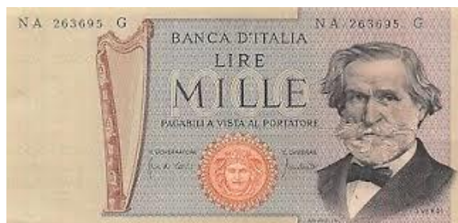
Olaszország, G. Verdi, 1000 líra, 1969, hárfa, Milánói Scala