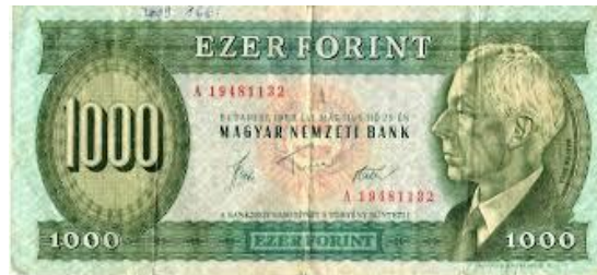
Nem Bartók Béla portréja került az első ezer forintosokra (1983) hanem Medgyessy Ferenc Szoptató anyja (1917/1932) munkája.

A nem-eurót használó országok bankjegyei közül is bemutatok néhányat: