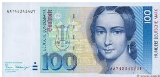
Németország, Clara Schumann, 100 márka, 1989, szülővárosa Lipcse épületei, hárfaszerű líra, zongora, frankfurti konzervatórium