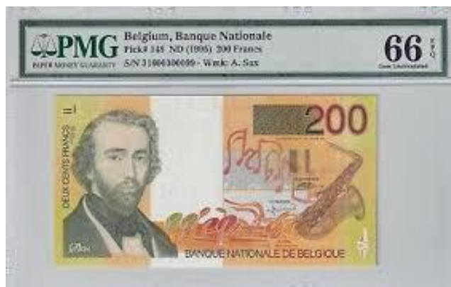
Belgium, Adolphe Sax, 200 frank, 1995, egy alak fújja a szaxofont