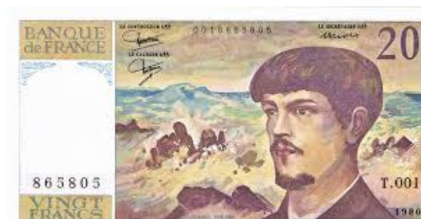
Franciaország, Debussy, 20 franc, 1980, táj tóval (a Pelléas és Mélisande színpada: táj tóval), tengerfelszín