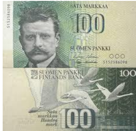
Finnország, Sibelius, 100 márka, 1986, repülő madarak