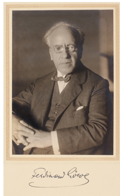
1924. karácsonyán Bécsben.