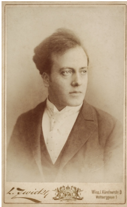
Ferdinand Löwe 1890-ben