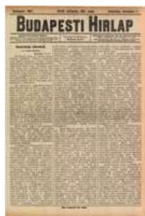
Budapesti Hírlap, 1907. december (27. évfolyam, 285-309. szám) 1907. 12. 15. / 297. szám (435. oldal)

(A bécsi udvari operában) a múlt héten mutatkozott be, mint annak idején említettük, az új karmester, Ferdinand Löwe, kiből sokan Hans Richter prezuntív utódját vélik. Kedden Löwe másodszor is dirigált, minden előzetes próba nélkül átvette a hirtelen megbetegedett Mahler igazgatótól a Lohengrin-előadás dirigálását és igazán művésziesen látta el karmesteri feladatát. Ez annyival is inkább dicsérendő, mert Löwe eddig távol maradt a színháztól, szinte csak a Bruckner szimfóniáknak élt és a Lohengrint jóformán először dirigálta. Tudásának és képességeinek ez kétségtelenül fényes bizonyítéka.