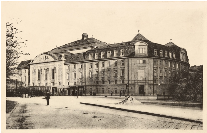
Wiener Konzerthaus, amely 1913-ban nyitotta meg kapuit a közönség számára.

1900-ban megalapítja az úgynevezett Wiener Konzertverein Orchester-t, amelynek neve 1933-tól Bécsi Szimfonikus Zenekar, amely idén ünnepli 125 éves jubileumát. Az együttest haláláig vezeti és utána a zenekar új első karmestere Löwe Ferdinand nagy tisztelője és mentoráltja, Wilhelm Furtwängler lesz. Közben 1908 és 1916 között Löwe a bécsi zenekar mellett első karmestere a München-i Konzertvereinorchesternek és tanára, majd 1918 és 1922 között rektora a Bécsi Zeneakadémiának. Komoly elismerésre tesz szert az uralkodó Ferenc Józsefnél, aki komoly elismeréssel segíti Bécs új zenekarának és karmesterének munkáját. Bár a Musikvereinsaal kiszolgálja Bécs hangversenyéletét, mégis új koncerttermet épített, amely épület felépülését Ferdinand Löwe felügyeli és ötleteivel segíti.