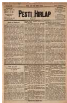
Pesti Hírlap, 1898. november (20. évfolyam, 302-331. szám) 1898. 11. 03. / 304. szám (51. oldal).