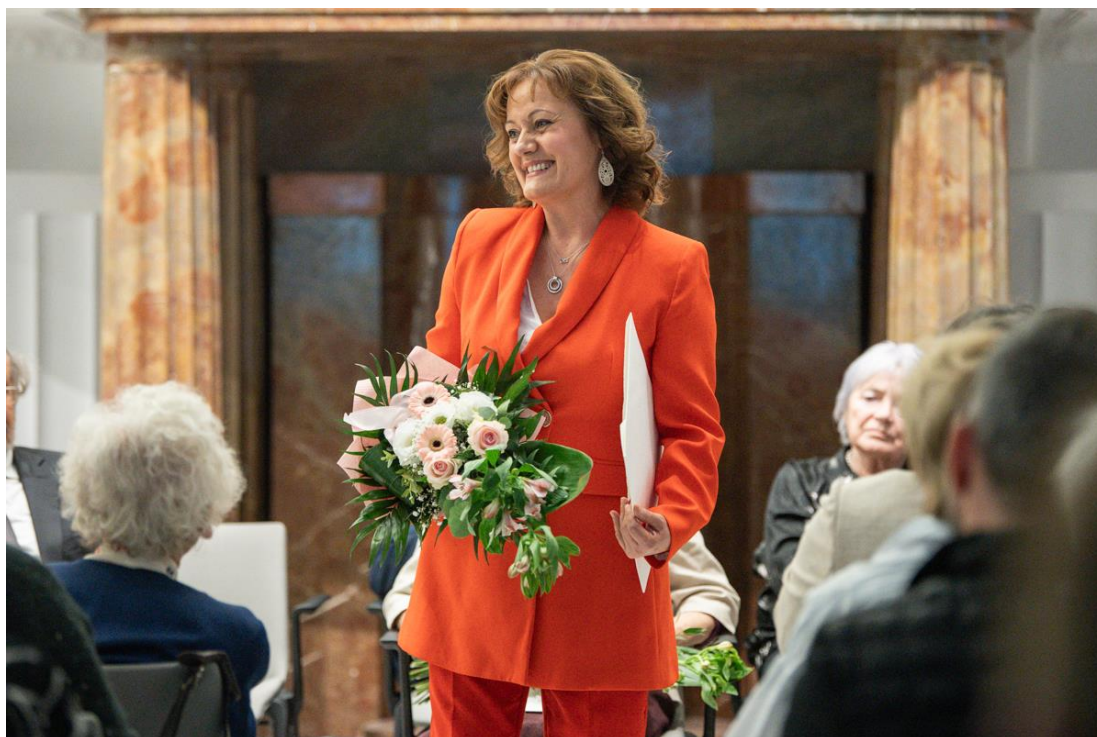
Simon Izabella az MMA díjátadó ünnepségén (2024)

Ha meghallottam a világhíró zongoraművésznő, Simon Izabella nevét, régebben az első, ami eszembe jutott, a végtelen érzékenysége volt, amellyel a zongorát megszólaltatja, akár szólolistaként, akár kamaramuzsikusként, akár énekes vagy hangszeres művészek zongorista partnereként. Elbűvöli a közönséget szerte a világon, ahol játszik, például a Wigmore Hallban, a Carnegie Hallban, Európa, Amerika, Új-Zéland rangos koncerttermeiben. Később, ahogyan figyeltem a tevékenységét, már az is eszembe jutott róla, hogy milyen jó, ha egy muzsikussal nyitott más művészetek iránt. Mennyire gazdagítja például a kamara.hu című fesztivált, amelyet férjével, a Kossuth-díjas Várjon Dénes zongoraművésszel együtt vezetnek, hogy a hangversenyeket és beszélgetéseket egy kimagasló irodalmi mű gondolati szálára fűzik fel. Az elmúlt években viszont a neve hallatán már attól is előnti a szívemet az öröm, hogy tudom, rendszeresen tart gyermekkoncerteket, pontosabban olyan művészeti programokat, amelyeken a zene mellett jelen van az irodalom, a festészet, és ahol a közönség soraiban ülő gyerekekkel együtt fedezik fel a művészeti alkotásokat. Izabella mindig hatalmas lelkesedéssel készül a gyerekekkel való találkozásra, ők pedig szárnyalnak vele, s a lelkükben sokáig őrzik a kapott élményt.