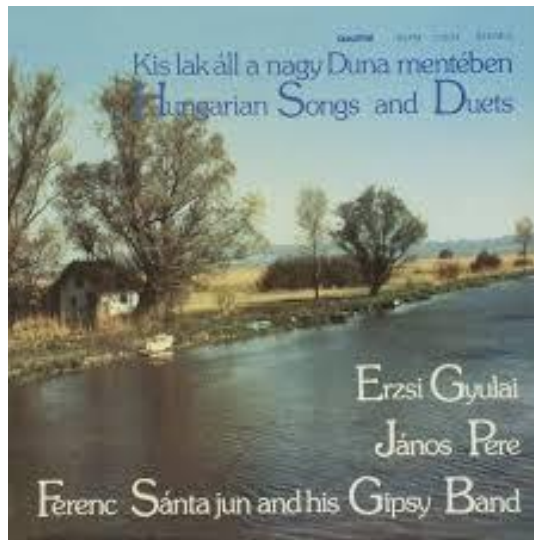
Teljes lejátszási lista megtekintése (23 felvétel) A kétszólamú dalok feldolgozása Péré János munkája © 1984 HUNGAROTON RECORDS LTD.