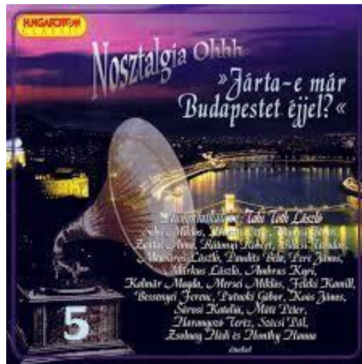
Nválnak már Budán az orgonavirágok (2:10)