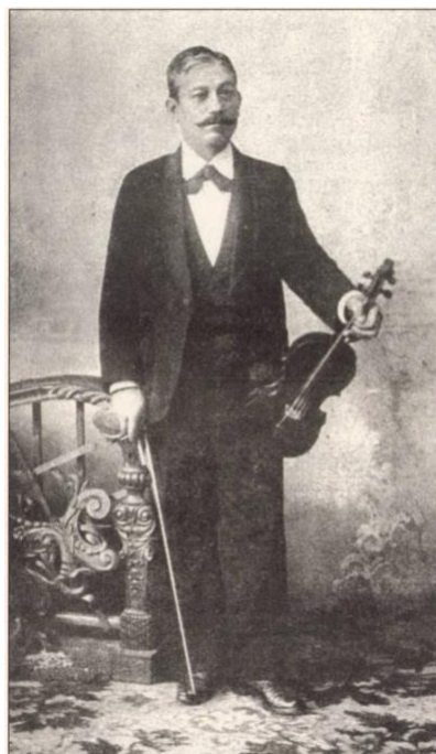
1. kép. Banda Marci. Markó Miklós: Czigányzenészek albuma , 63.