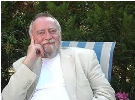
Victor Máté 2011-ben

Az Artisjus közgyűlése is úgy gondolta, az ő komplex személyisége alkalmas e nagy múltú szervezet irányítására, képviselésére.